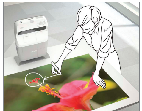
Projekcja na każdej poziomej płaszczyźnie, np. na blacie biurka