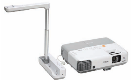
Udostępniaj obiekty 3D, używając wizualizera ELP-DC06