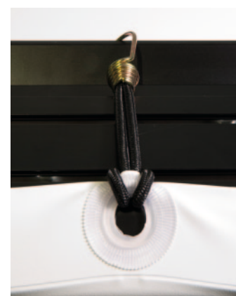
▲ Elastyczne gumki oraz oczko powierzchni projekcyjnej

Ekran Cinema Curved jest dostępny z powierzchniami do projekcji przedniej, które w produktach tej wielkości (szerokość podstawy od 7 do 24 m) są zgrzewane pionowo.