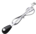
Zewnętrzny odbiornik IR