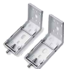
Uchwyty - montaż niezależny